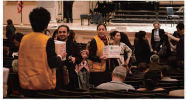
ニューヨーク日系ライオンズクラブの募金活動